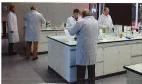
Visite dans un laboratoire de chimie.

C'est sur le site de Technorama, le 22 mars dernier à Winterthour, que les experts se sont retrouvés pour leur assemblée annuelle.